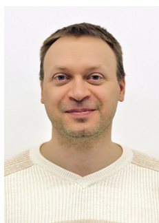
Александр В. Сахаров